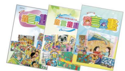
「溫馨家園」童言童畫入圍作品集